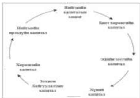
Зураг 2. Нийгмийн капиталын цикл

Төр өөрөө маш томоохон хэмжээний капиталыг эзэмшдэг. Тиймээс хувийн хэвшил үйл ажиллагаандаа төртэй хамтрах нь тэдэнд хялбар болж ирдэг.