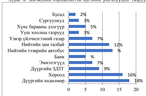
Зураг 3. Хөгжлийн бэрхшээлтэй иргэний үйлчлүүдэг газрууд