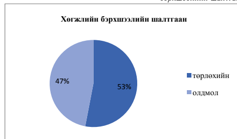
Зураг 2. Судалгаанд хамрагдсан хөгжлийн бэрхшээлийн шалтгаан

Судалгаанд хамрагдсан Хөгжлийн бэрхшээлтэй иргэдийн 53% нь эрэгтэй 49% нь эмэгтэй нь байна.