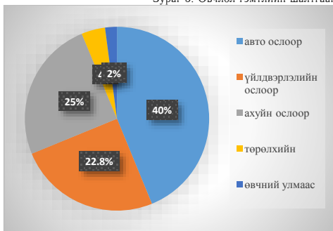
Зураг 5. Өвчлөл гэмтлийн шалтгаан

Нийгмийн харилцаанд тэгш эрхтэй оролцоход юу саад болж буй талаарх асуултад 2,36% нь өөрөө сонирхолгүй, 27,6% нь нийгмийн харилцаа, 80,0% нь зам шат хаалга, 98,0% нь унаа гэсэн хариултыг өгчээ. Нийтийн тээврийн аль