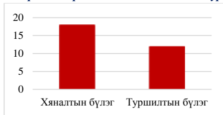
1-р гистограмм. Хяналтын болон туршилтын бүлгийн харьцаа

Бясалгал нүдний мэс заслын эмч нарын сэтгэцийн зарим үйл ажиллагаанд болон гүйцэтгэсэн нүдний бичил мэс заслын амжилт, үр дүнд хэрхэн нөлөөлдөг болохыг тодорхойлох тус судалгааг бид хэд хэдэн үе шатаар явуулав.