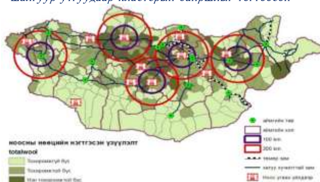
Эх сурвалж: Одмаа П.Нэхмэлийн салбарт аж үйлдвэрийн кластерийг хөгжүүлэх асуудал

Сүүлийн жилүүдэд бэлчээрийн доройтол, байгалийн гамшгийн давтамж нэмэгдэж байгаагаас малчдын мал аж ахуйн хөдөлмөр эрхлэх эрх чөлөө хумигдан төв суурин бараадах сонголт үлддэг.