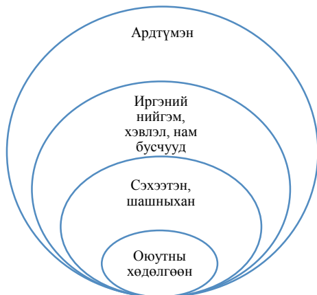
Зураг 2. БНСУ-ын ардчилсан хөдөлгөөний гол хүчин

тариалан эрхэлж байсан хүмүүс төдийгүй бусад хүчнүүдтэй ч эвсэн нэгдэх үзэлтэй байсан юм” хэмээн тэмдэглэжээ (최현명, 2001:13).