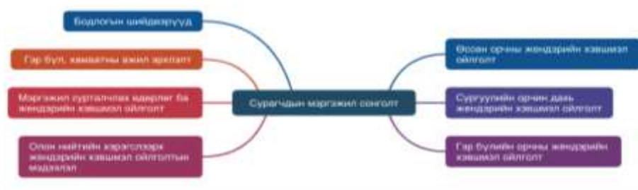
Зураг 1. Сурагчдын мэргэжил сонголтод нөлөөлөгч хүчин зүйлс

Энэхүү ойлголт нь дараах дөрвөн агуулгаар илэрхийлэгдэнэ.