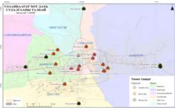
Эх сурвалж: Судлаачийн боловсруулснаар

Говь-Алтай аймаг нь судалгааны 2 дахь талбар бөгөөд Улаанбаатар хотоос 1001 км зайтай, хол байршилтай аймгуудыг төлөөлж сонгогдсон. Аймгийн төв, сумын төв, орон нутгийн малчдын хүүхдүүд нүүдлийн соёл, өдөр тутмын амьдрал дахь улирлын онцлогоос шалтгаалан өөр өөр амьдралын нөхцөлтэй тулгардаг. Иймд хязгаар нутгийг сонгох нь