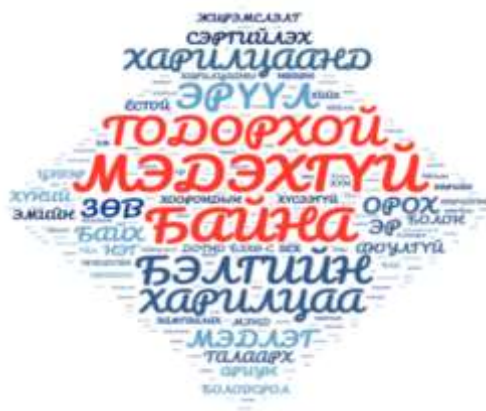
Зураг 1. Судалгаанд оролцогчдын бэлгийн боловсролын талаарх ойлголт

Судалгаанд оролцогчдын бэлгийн боловсролын талаарх мэдээллийг хаанаас авдаг болохыг олон сонголтот байдлаар асуухад 24,6% нь багш сургуулиас, 22% нь интернэтээс авдаг байна (Хүснэгт. 1). Энэ нь Монгол, Финланд болон