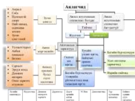
Эх сурвалж: Дэлхийн Аялал Жуулчлалын Байгууллагын тодорхойлолт

Аялал жуулчлалын үйл ажиллагаа явагдах бүс, хамрах хэмжээ, аялал жуулчлалын үйлдвэрлэлийн байгууллагуудын ангилал зах зээлийн дараах байдлаар ялган тогтоосон [5].