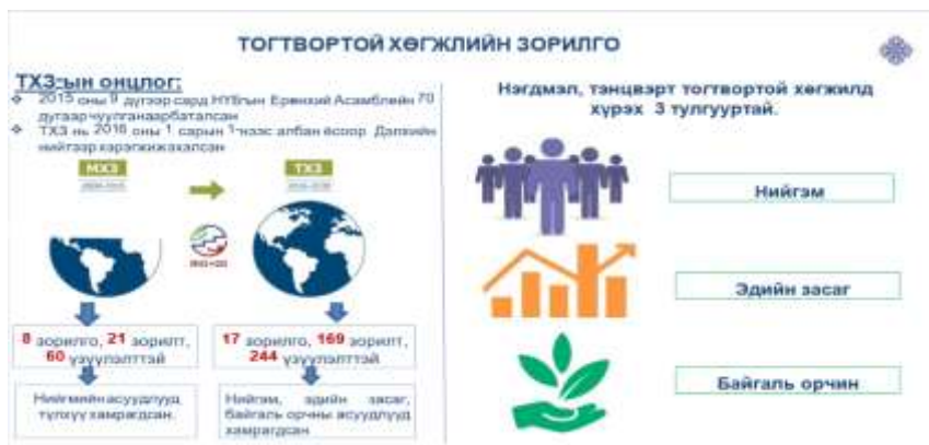
Зураг 5. Тогтвортой хөгжлийн зорилго, бүтэц

2015 онд НҮБ-ын Ерөнхий Асамблейн 70 дугаар чуулган болж, ТХЗ-ын 17 зорилго, 169 зорилтыг баталж, 2016 оны 1 сарын 1-нээс “Тогтвортой хөгжлийн зорилго” албан ёсоор дэлхий нийтээр хэрэгжиж эхэлсэн байна.