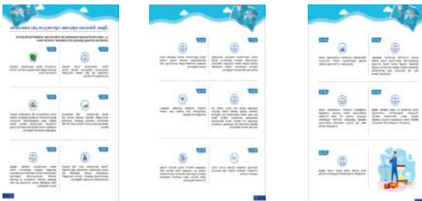
Эх сурвалж: Төрөөс Аялал жуулчлалыг хөгжүүлэх талаар баримтлах бодлогын баримт бичиг 2019