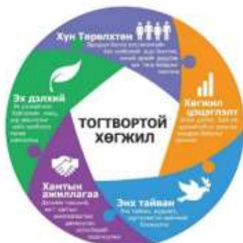
Зураг 3. Тогтвортой хөгжлийн 5 бүрдэл хэсэг