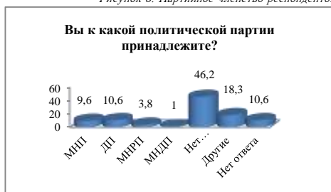
Рисунок 3. Партийное членство респондентов

Из ответов респондентов выходит, что 46,2% из них не имеют партийного членства. Из этого выходит, что в будущих выборах около 50 процентов избирателей будут делать свой выбор исходя из тогдашних обстоятельств. Однако тогда, как нами было предложено активно действующих и новых 9 имён партий, за ответ “другая партия” проголосовали 18,3% респондентов, что заставляет усомниться в правильности ответов на данный вопрос. В связи с тем, что в нашей стране распространено явление “намчирхах”, что означает отрицательное определение партийного членства, то граждане не особо хотят демонстрировать свое партийное членство и скрывают свое членство в политических партиях. Кроме того, по данным других исследователей, один из 3 избирателей в Монголии является членом какой-либо партии. Исходя из этого выходит, что 30 процентов избирателей не имеют партийного членства, а в нашем исследовании эта цифра