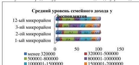
Рисунок 1. Средний уровень семейного дохода у респондентов

При исследовании электорального поведения избирателей Монголии первостепенное значение