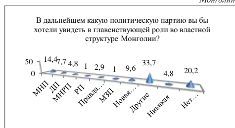
Рисунок 5. В дальнейшем какую политическую партию вы бы хотели увидеть в главенствующей роли во властной структуре Монголии?

На рисунке видно, что самый большой процент 33,7% респондентов ответили “Другие”, что говорит либо о неопределённости либо о желании увидеть сильное третье течение в политической жизни страны. 59,32% респондентов с высшим образованием и 36,84% респондентов со средним образованием выбрали такие ответы, как “Новая партия” и “Другие”, что показывает их недоверчивое отношение к уже существующим партиям. А также из ныне действующих известных