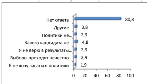
Рисунок 4. Почему не хотите участвовать в выборах

Тот факт, что большинство не ответили, является следствием того, что данные респонденты ответили, что собираются участвовать в грядущих выборах. Из других ответов самый большой процент 4,8% занимает ответ “Всё равно, кого выберут”.