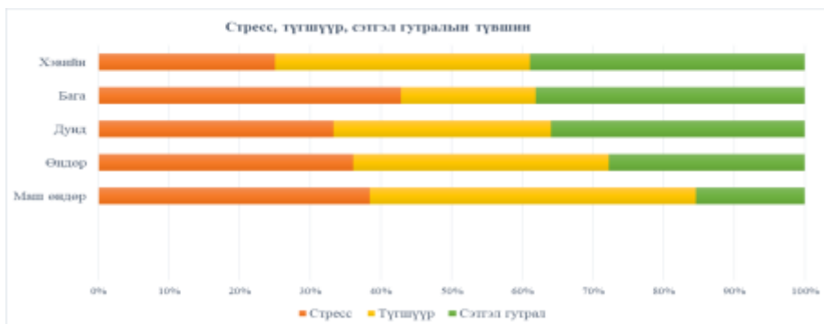
Зураг 2. Стресс, түгшүүр, сэтгэл гутралын түвшин

Стрессийн түвшинг үнэлэхэд 18% нь хэвийн, 18% нь бага, 26% нь дунд, 28% нь өндөр, 10% нь маш өндөр байна. Энэхүү үзүүлэлтийг хүйсийн хувьд авч үзвэл эмэгтэйчүүд эрэгтэйчүүдээс стрессийн түвшин өндөр, эрэгтэйчүүдийн ихэнх хувь нь бага, хэвийн гэсэн хариултуудыг өгсөн байна. Мөн боловсрол болон орлогын түвшин багасах тусам стрессийн түвшин нэмэгдсэн үзүүлэлттэй байна.