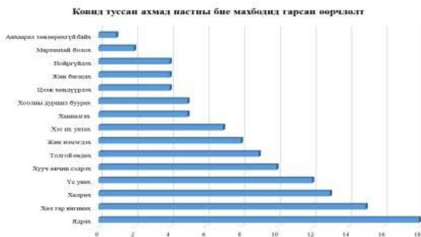
Зураг 1. Ковид туссан ахмад настны бие махбодид гарсан өөрчлөлт

Судалгаанд оролцогчдын 52% нь ковидоор өвдсөн бөгөөд эдгэсний дараа ч дийлэнхид нь ядрах, хөл гар нь янгинах, хөлрөх, хууч өвчин нь сэдэрэх шинж тэмдэг ихээр илэрсээр байна.