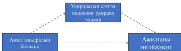
Зураг 1. Судалгааны загвар

Удирдлага ажилчидтайгаа харьцах харьцаа, өөрийгөө үнэлэх, бусдад хэрхэн сэтгэгдэл төрүүлэх нь ажилчидын энгейжментэд нөлөөлдөг байна. Иймээс дараахь байдлаар таамаглал дэвшүүлж баталлаа.