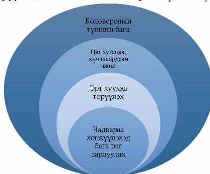
Зураг 1. Ядууралд нөлөөлж байгаа хувь хүний хүчин зүйлс

Түүнчлэн гэрт байх хугацаандаа нийгмийн харилцаанаас тусгаарлагдах, кино үзэх, унтах зэрэгт нэлээдгүй хугацааг зарцуулж байгаа байдал мөн судалгаанд оролцогчдын дунд түгээмэл байна. Энэ нь нөгөө талаас өөрийн боловсрол, ур чадвараа хөгжүүлэхэд цаг зарцуулж чадахгүй байхад хүргэж байна.