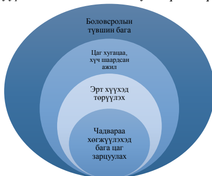
Зураг 1. Ядууралд нөлөөлж байгаа хувь хүний хүчин зүйлс

Түүнчлэн гэрт байх хугацаандаа нийгмийн харилцаанаас тусгаарлагдах, кино үзэх, унтах зэрэгт нэлээдгүй хугацааг зарцуулж байгаа байдал мөн судалгаанд оролцогчдын дунд түгээмэл байна. Энэ нь нөгөө талаас өөрийн боловсрол, ур чадвараа хөгжүүлэхэд цаг зарцуулж чадахгүй байхад хүргэж байна.